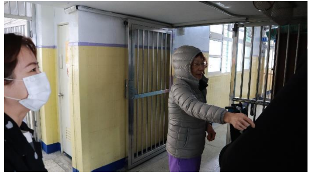
視察委員視察夜間新收檢身處所