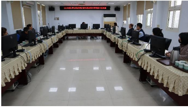
視察委員聽取承辦科室業務報告