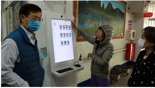
視察委員視察智慧購物系統運作情形